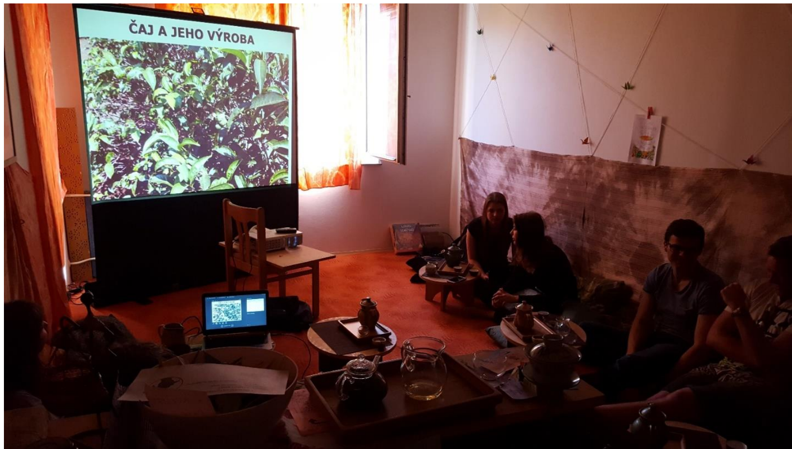
Degustace čajů v čajovně