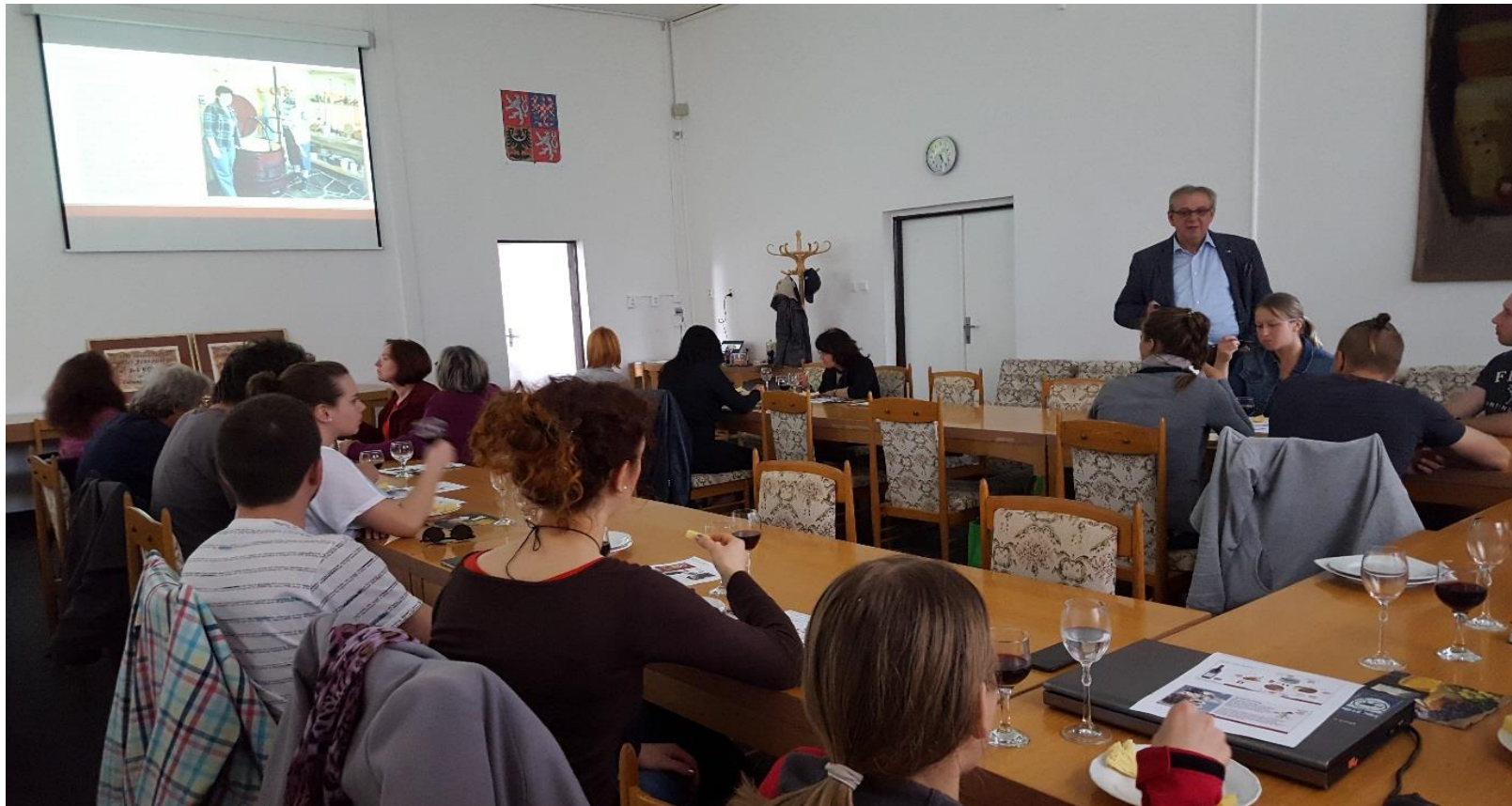
Degustace sýrů a vín